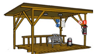
Rys. 1. Stanowisko pracy piły tarczowej stołowej