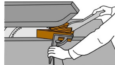
Rys. 2. Popychacze